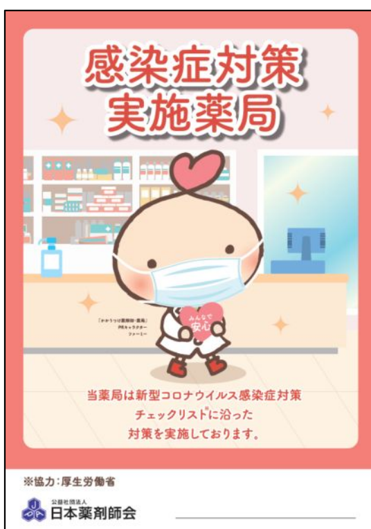
みんなですん安心マーク

本会が作成する同マークについては、「薬局内における新型コロナウイルス感染症対策チェックシート【第二版】」及び「薬局内における新型コロナウイルス感染症対策チェックリスト」(項目は別紙3を参照)の全ての項目を実践していることを自己確認の上、同マークとともに「薬局内における新型コロナウイルス感染症対策チェックリスト」を掲出することで使用が可能となっている。